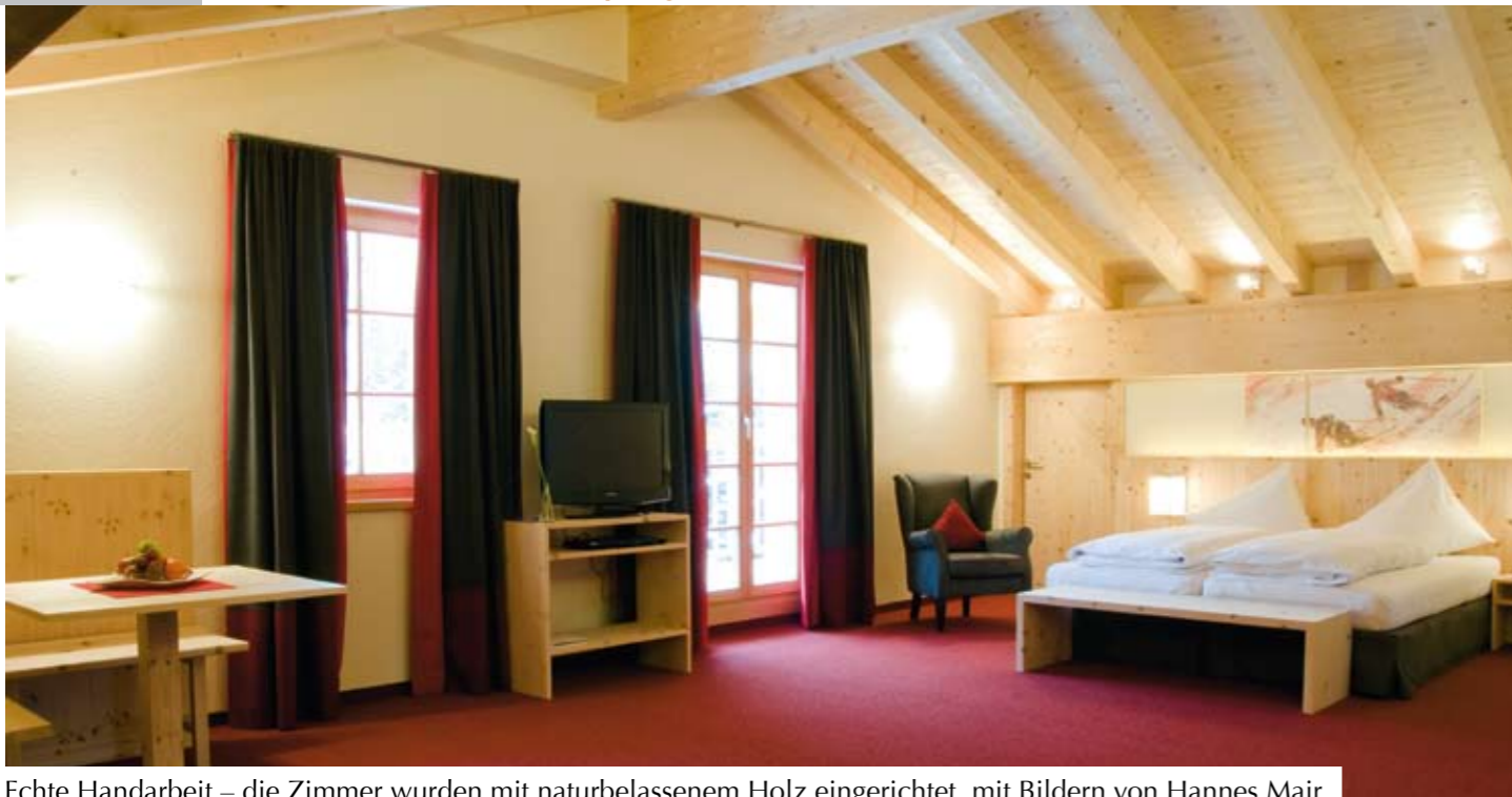
Echte Handarbeit – die Zimmer wurden mit naturbelassenem Holz eingerichtet, mit Bildern von Hannes Mair.