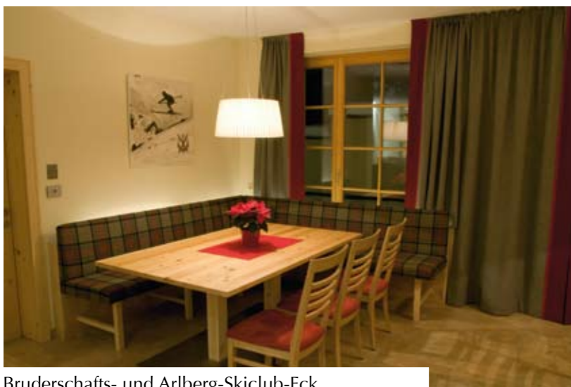
Bruderschafts- und Arlberg-Skiclub-Eck.