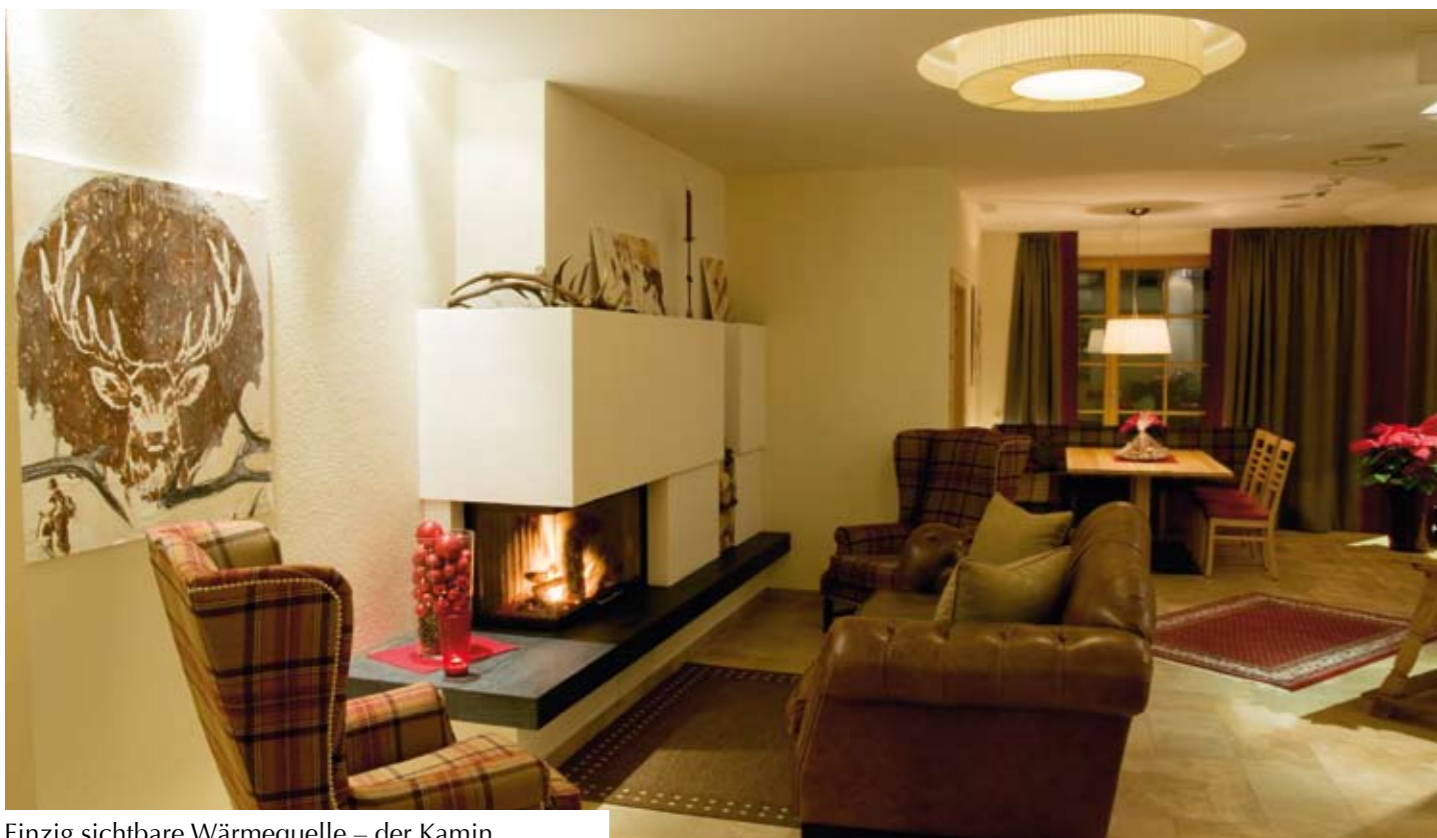
Einzig sichtbare Wärmequelle – der Kamin.