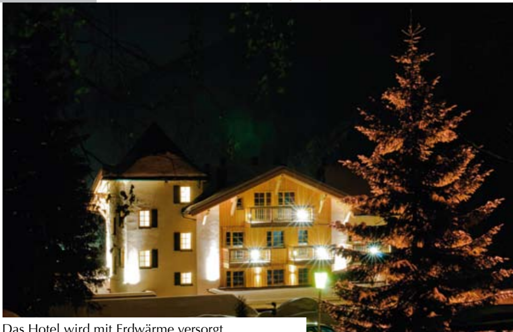
Das Hotel wird mit Erdwärme versorgt.